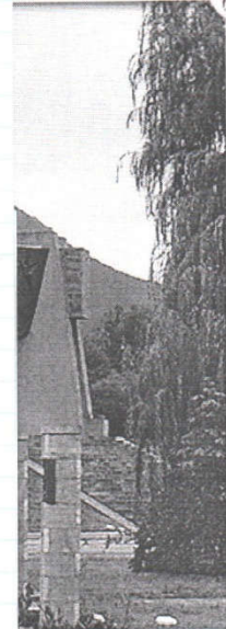
1 правильный ответ; за

Учитель: Дуркина А.П. 10 октября 2018 г.